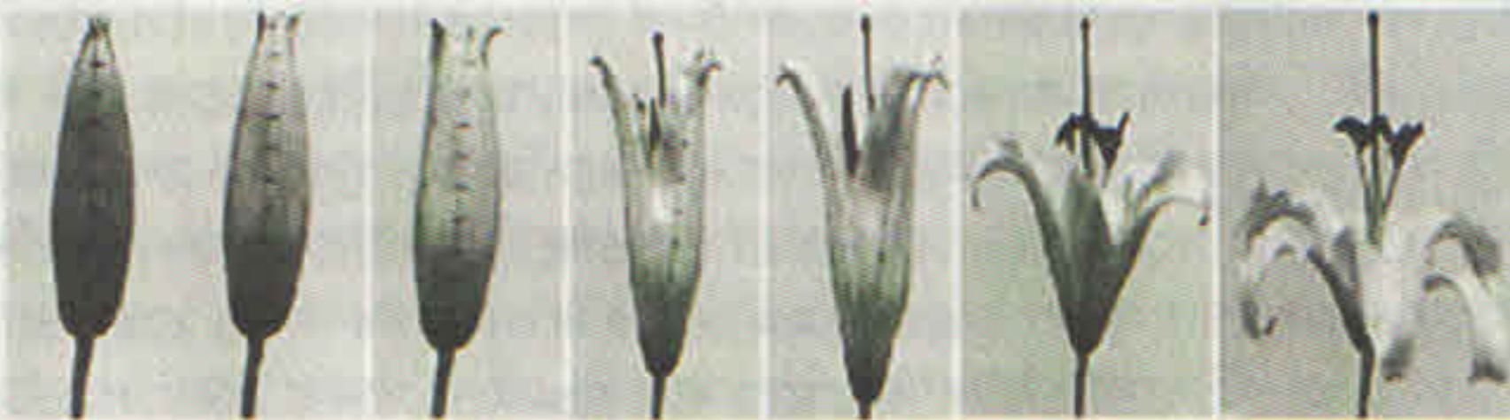
ধীরে ধীরে ফুল ফুটেছে

কোন ধরনের পাপড়ি কত তাড়াতাড়ি ফুটে উঠবে। এইসব বিষয় এখন সহজেই পরীক্ষা করে নেওয়া যাবে, এবং বিজ্ঞানীরা বিভিন্ন ফুল ফোটার হার মেপে এই তত্ত্বের যথার্থ্য নির্ধারণ করতে পারবেন। অবশ্য এই অসমান হার বজায় রাখার জন্য রাসায়নিক স্তরে কী হচ্ছে বা কোষের ভেতরে কোন জিন-এর জন্য এমনটা ঘটে, সেটা এখনও অজানা রয়ে গেছে। তবে প্রাণিজগতের ঘটনার সঙ্গে পদার্থবিজ্ঞানের বা গণিতের যোগসূত্রগুলো যে আজকাল ক্রমশ প্রতীয়মান হয়ে উঠছে, এই গবেষণা তারই একটা উদাহরণ। এই গবেষণা এটাই প্রমাণ করে যে, প্রাণিজগতের সব ধরনের ঘটনার পিছনেই যে জিনের প্রভাবকে টেনে আনতে হবে, তেমন কোনও কথা নেই। পদার্থের বৈশিষ্ট্যও প্রাণিজগতের বিভিন্ন জিনিসের আকার