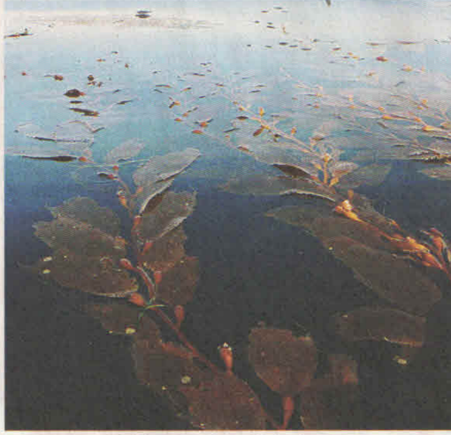
স্থির জলে ভাসমান পাতার গড়ন

পাপড়ির বিভিন্ন অংশের বৃদ্ধির হার মাপার জন্য বিজ্ঞানীরা তার ওপর কালো কালি দিয়ে সমান দূরত্বে পর পর কয়েকটি বিন্দু এঁকে দেন, কয়েকটা তার মধ্যশিরার ওপর এবং