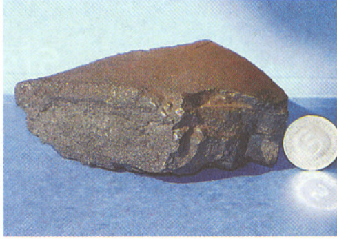
শুধু তাই নয়

প্রথমত, এই এক রেখায় এসে দাঁড়ানোর গল্পটাই ভুল। সমুদ্রের নীচে থেকে পাওয়া ভারী লোহা, নক্ষত্রের ছাই